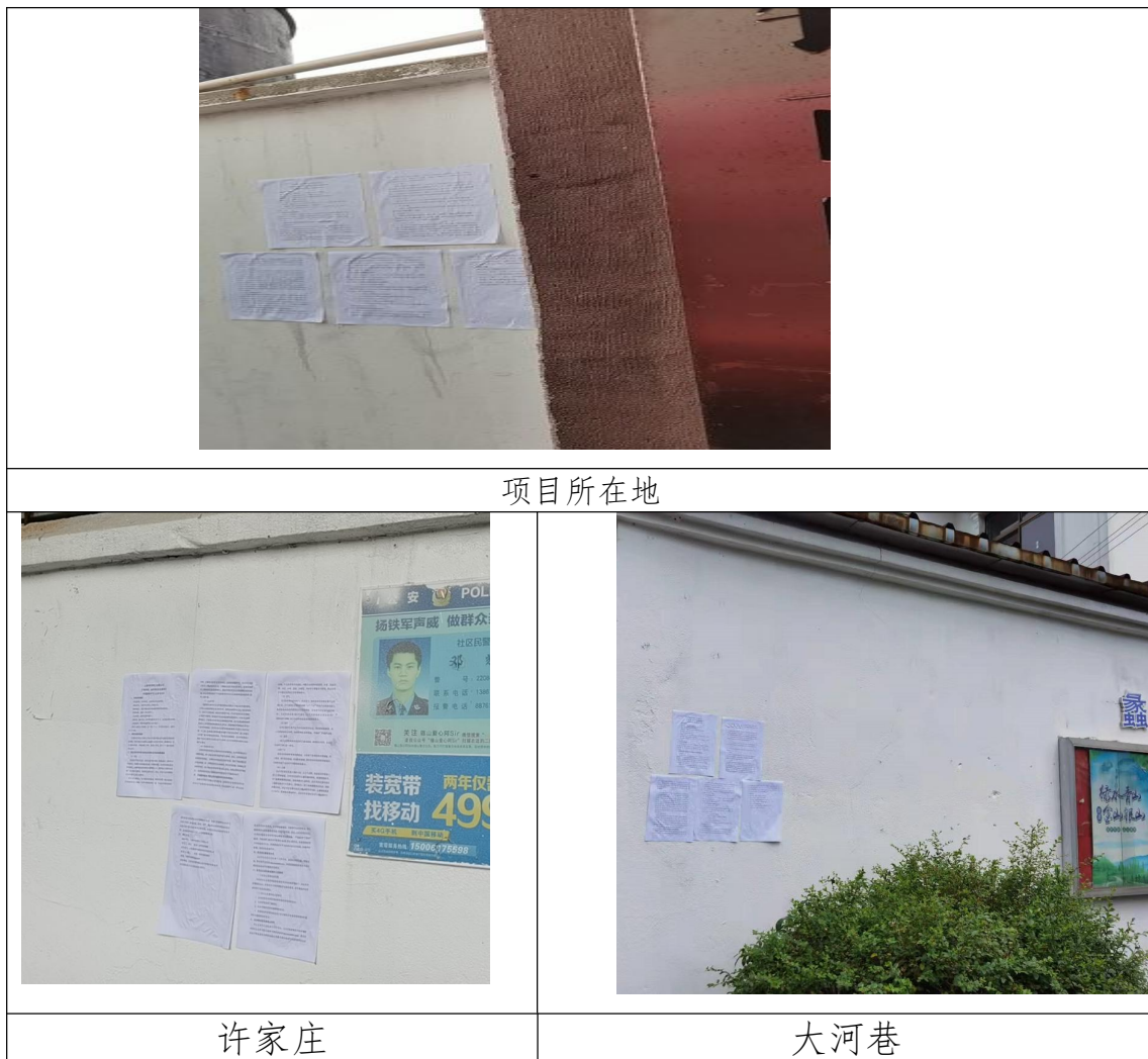
图 3.2-6 征求意见稿公示现场张贴公告情况