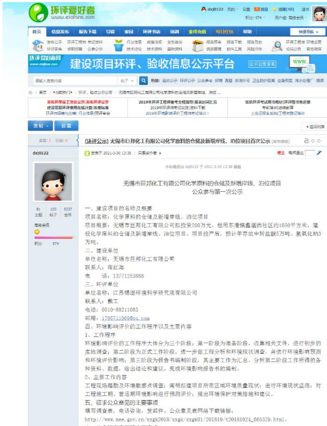
图 2.2-1 环评爱好者论坛首次公示截图