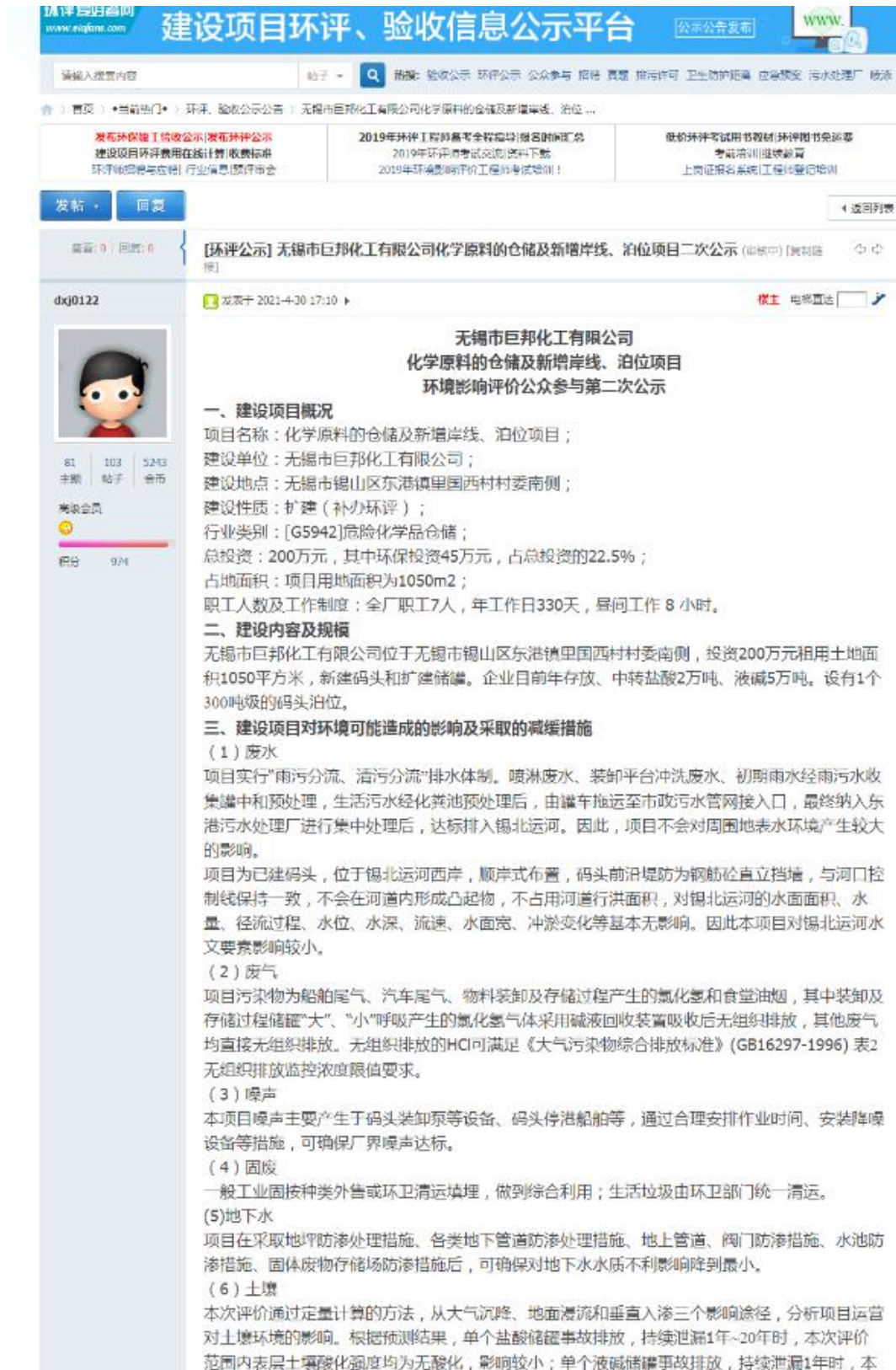
图 3.2-1 环评爱好者网站征求意见稿公示一