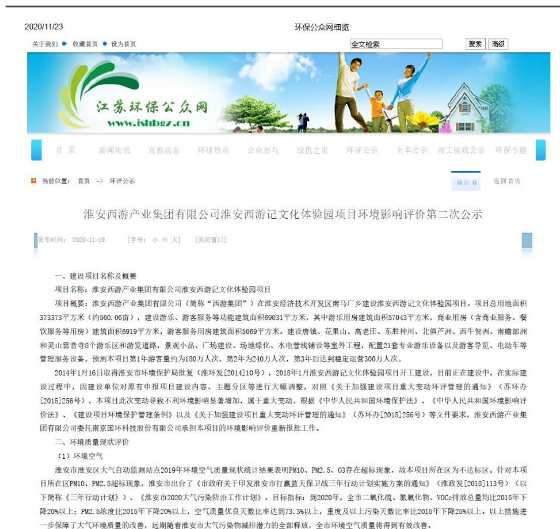
图 3.2-1 第二次网络公示截图

本项目环境影响报告书征求意见稿首先采用网络公示，公示网站为江苏环保公众网站上，网站对外公开。公示时限为 2020 年 11 月 19 日至 2020 年 12 月 2 日，公示有效期为 10 个工作日。网页截图见图 3.2-1。