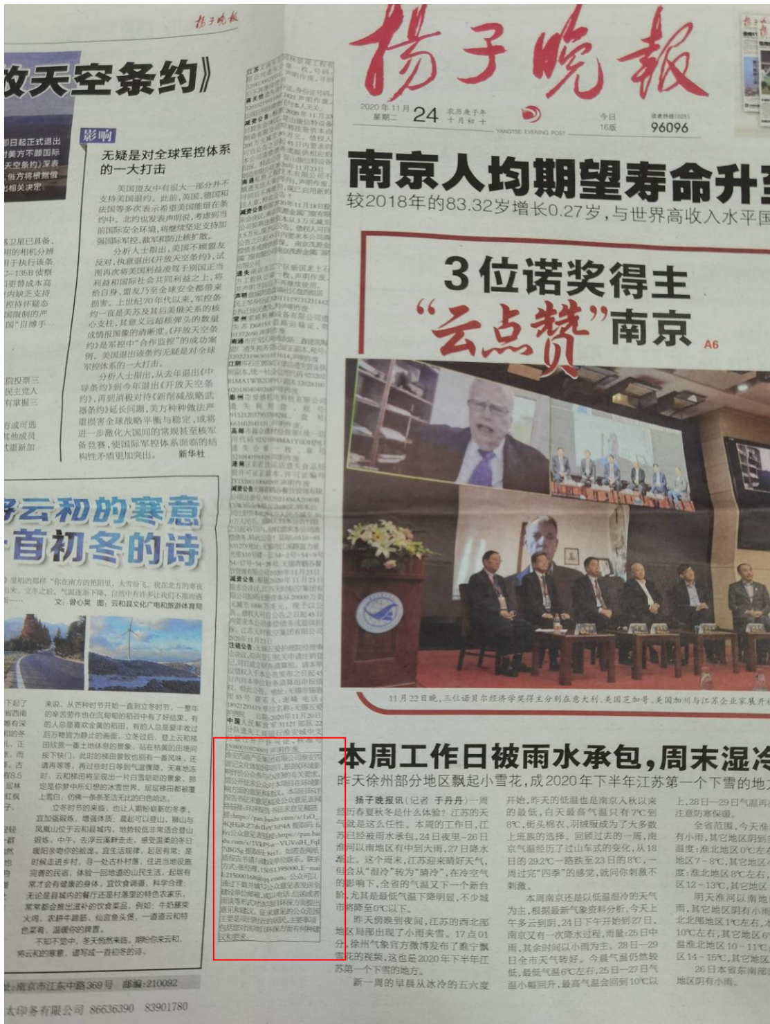
图 3.2-2 报纸公示照片（两次）