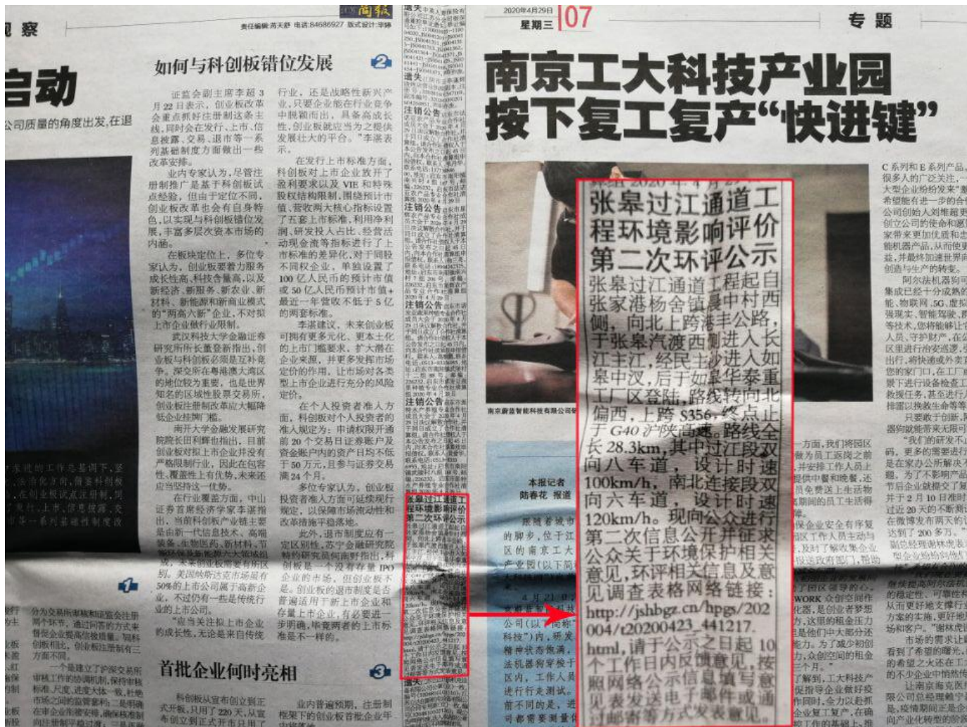
图 3.2-2 第一次报纸公示截图