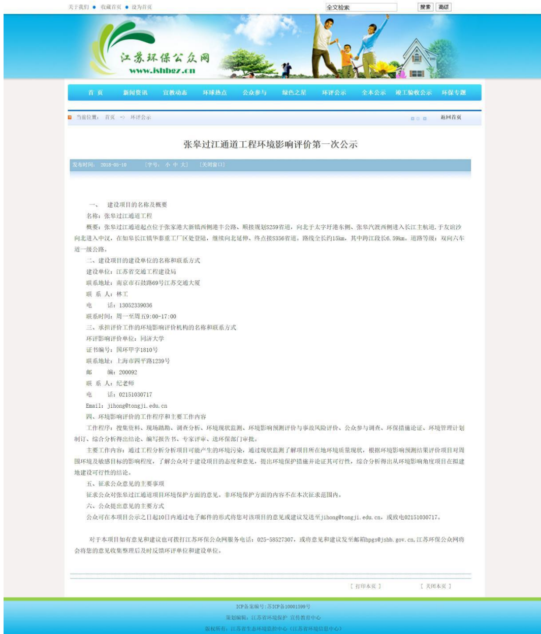
图 2.2-1 江苏环保公众网第一次公示截图