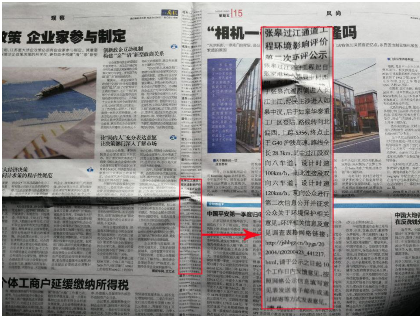
图 3.2-3 第二次报纸公示截图