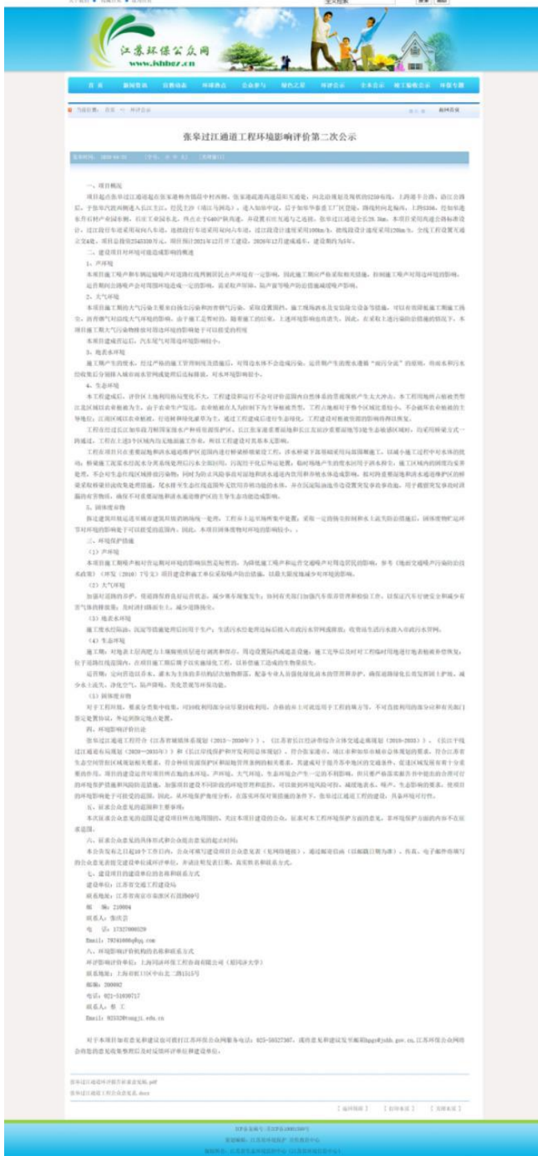
图 3.2-1 江苏环保公众网第二次公示截图