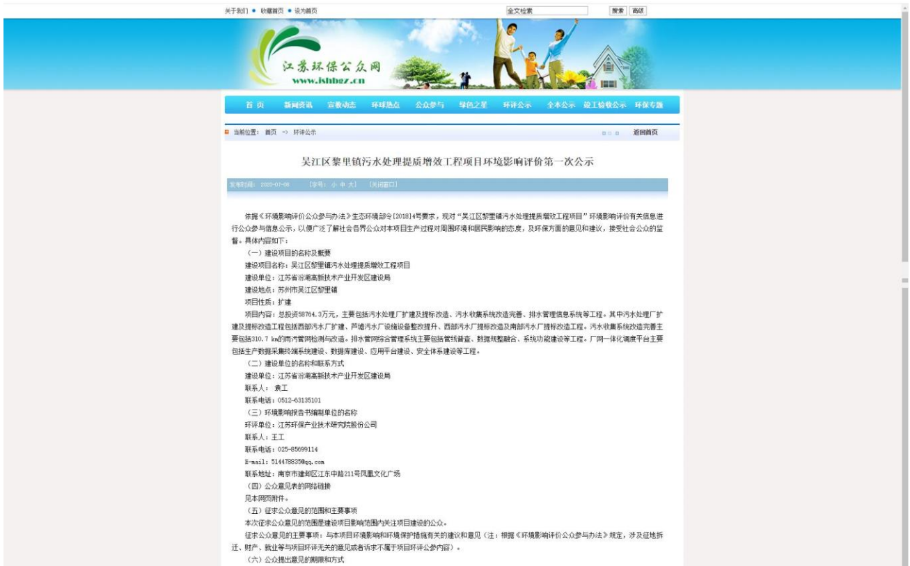
图 2-1 第一次网上公示截图