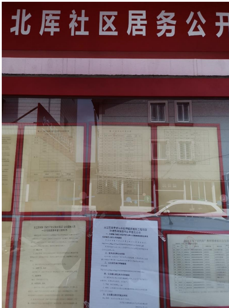
北库社区张贴公示