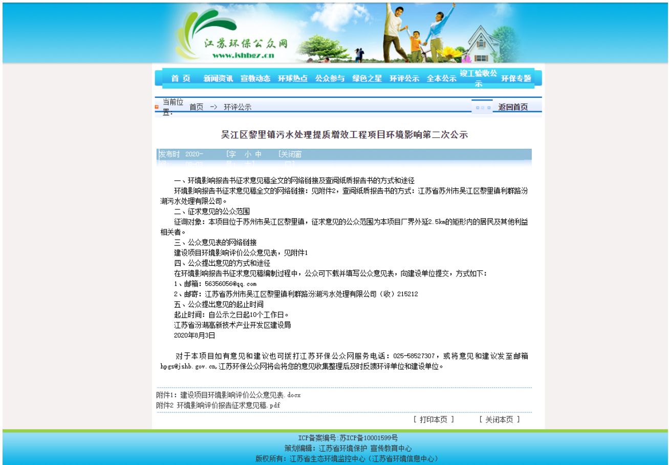
图 3-1 第二次网上公示截图