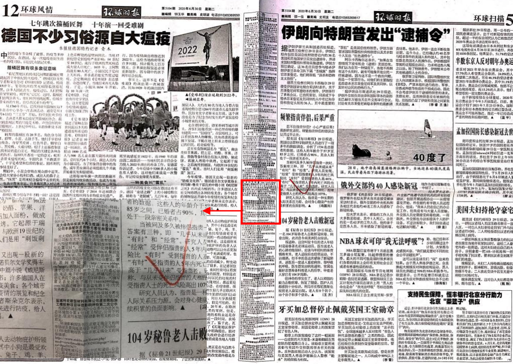
图 3.2-2(1) 本项目报纸公开截图 (6月30日)