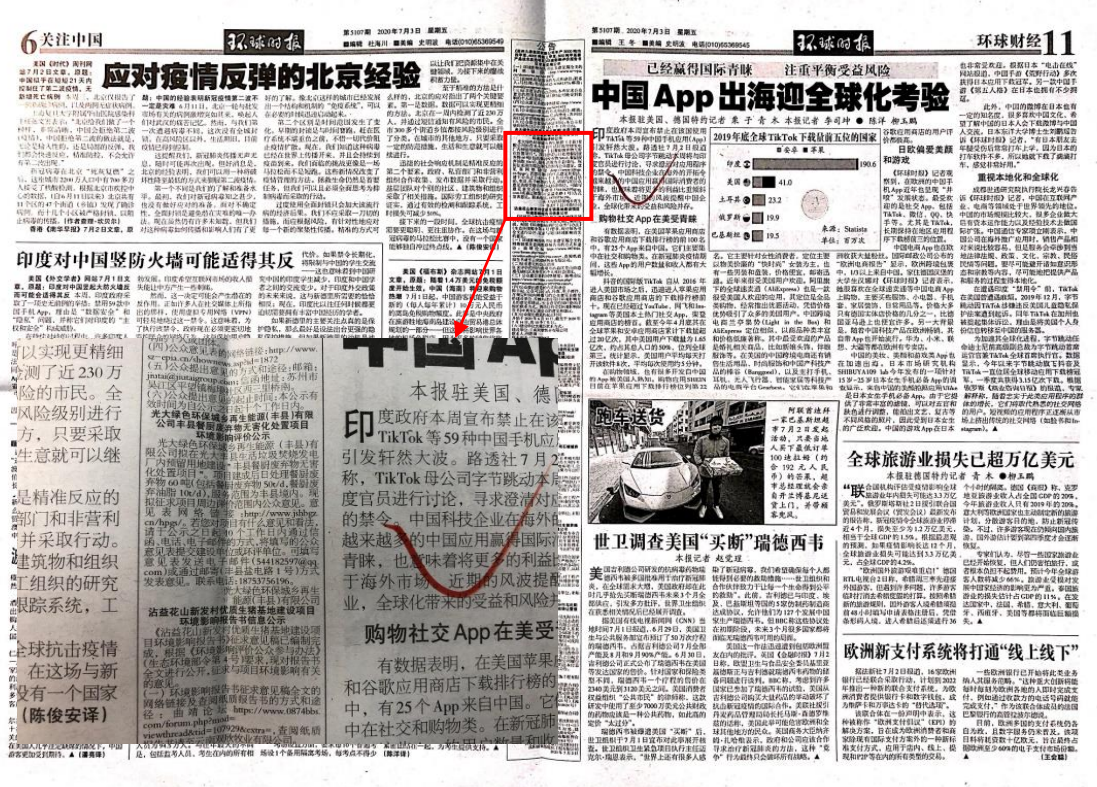
图 3.2-2(2) 本项目报纸公开截图 (7月3日)