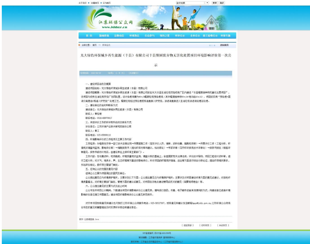
图 2.2-1 第一次网络公示截图