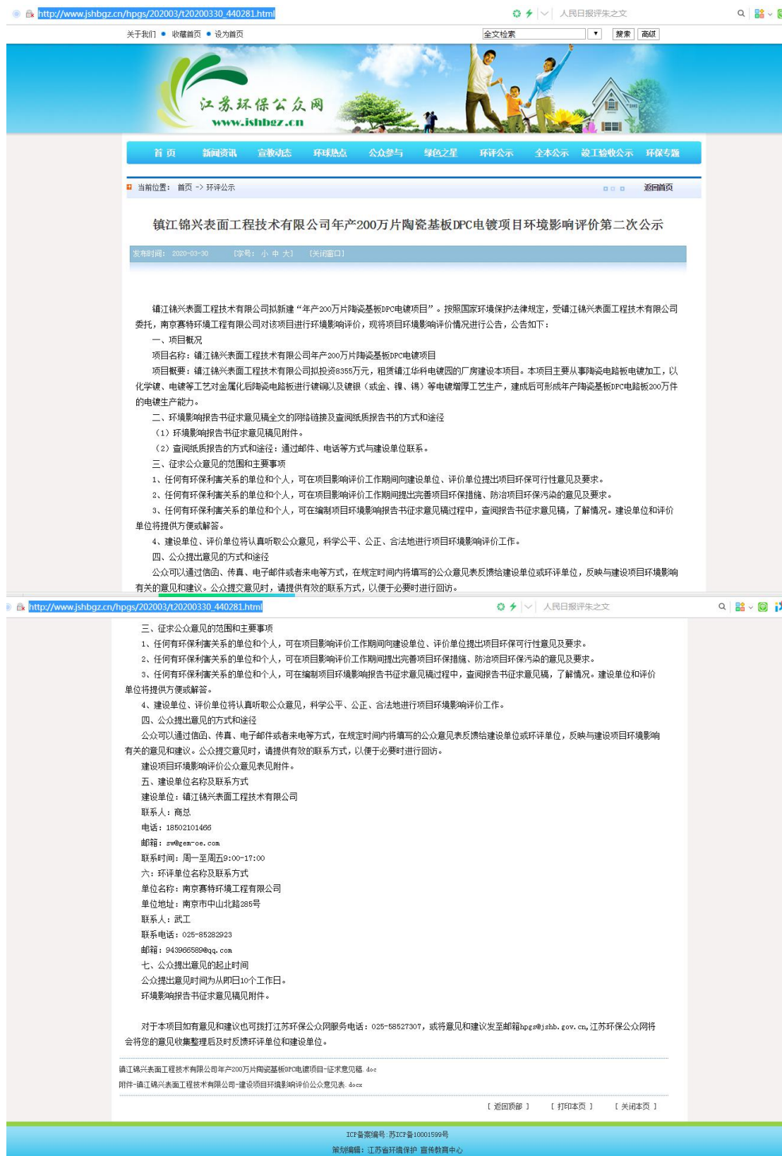
图 3-1 第二次网上公示截图