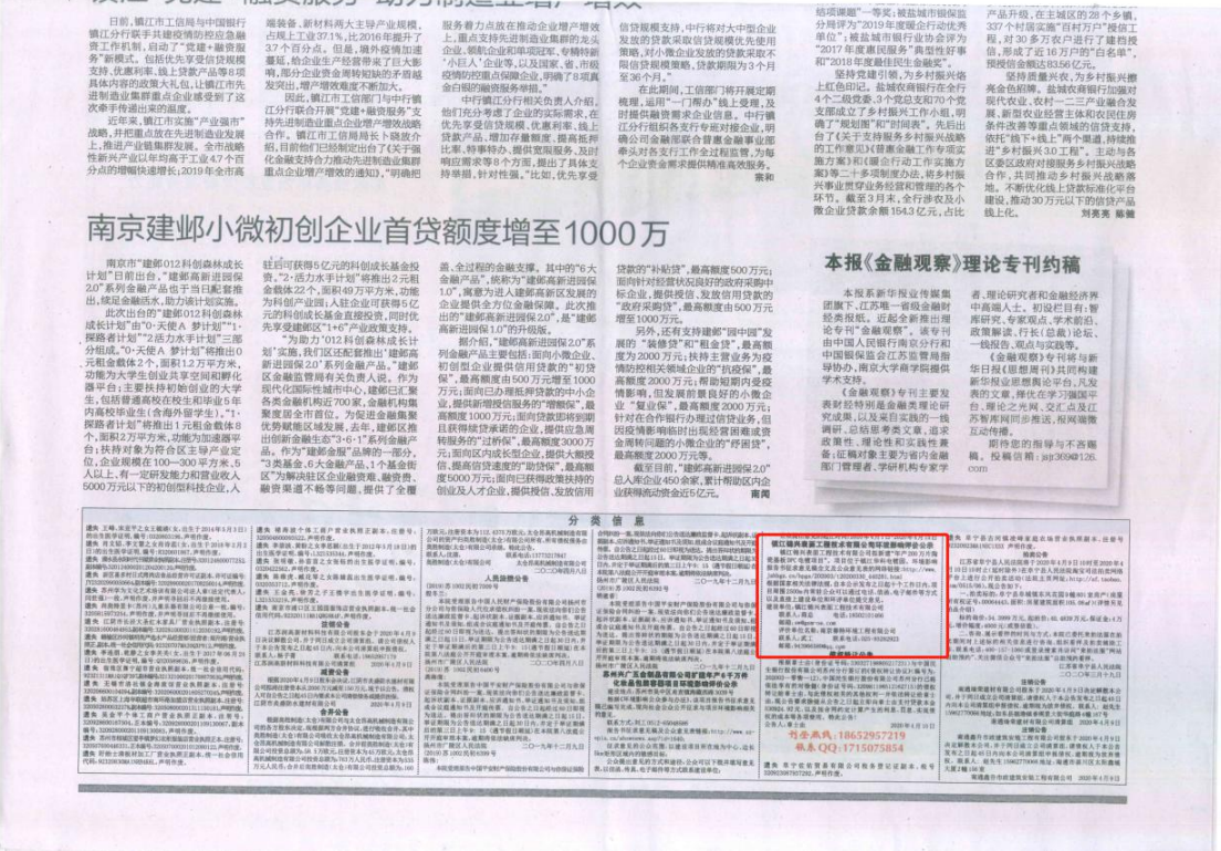
图3-2 2020年4月9日报纸公示截图