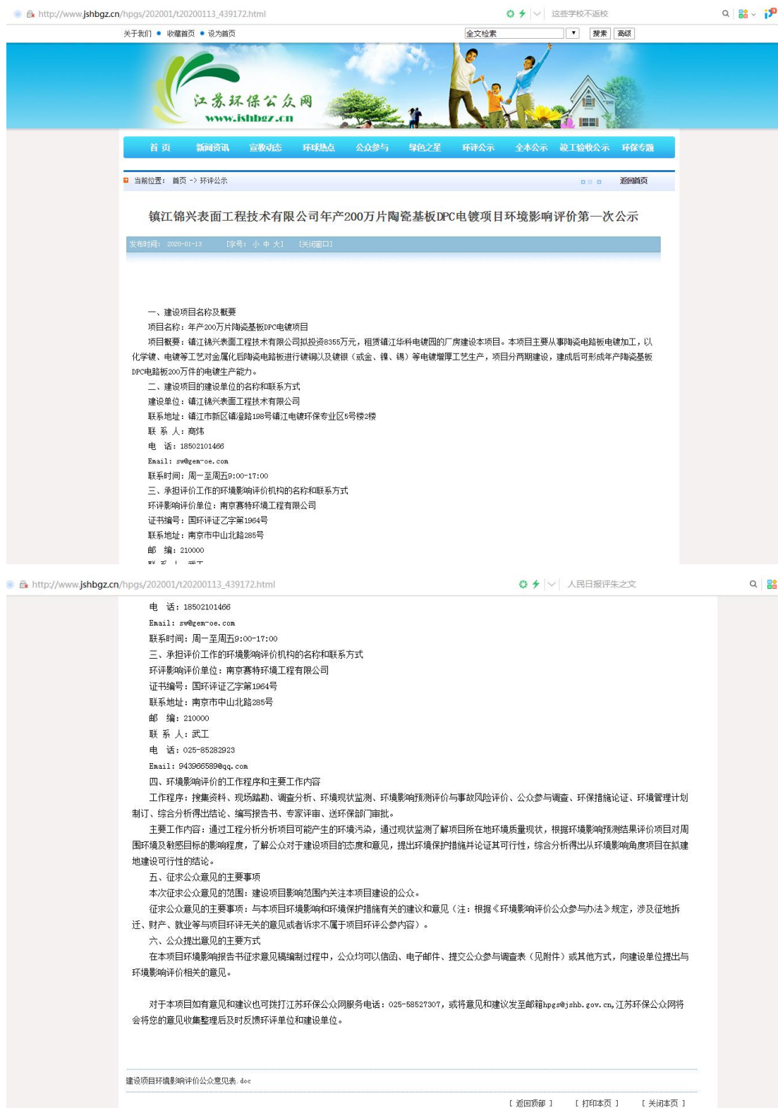
图 2-1 第一次网上公示截图