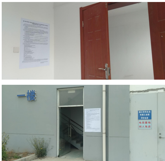
图 3-4 张贴公告照片图