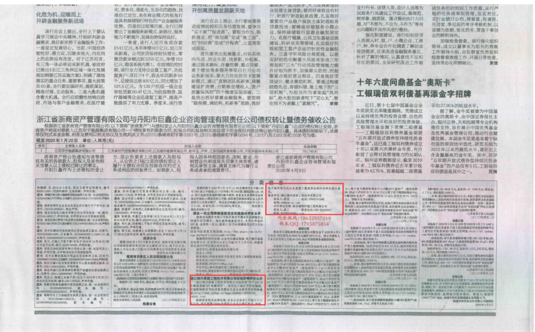
图3-3 2020年4月10日报纸公示截图