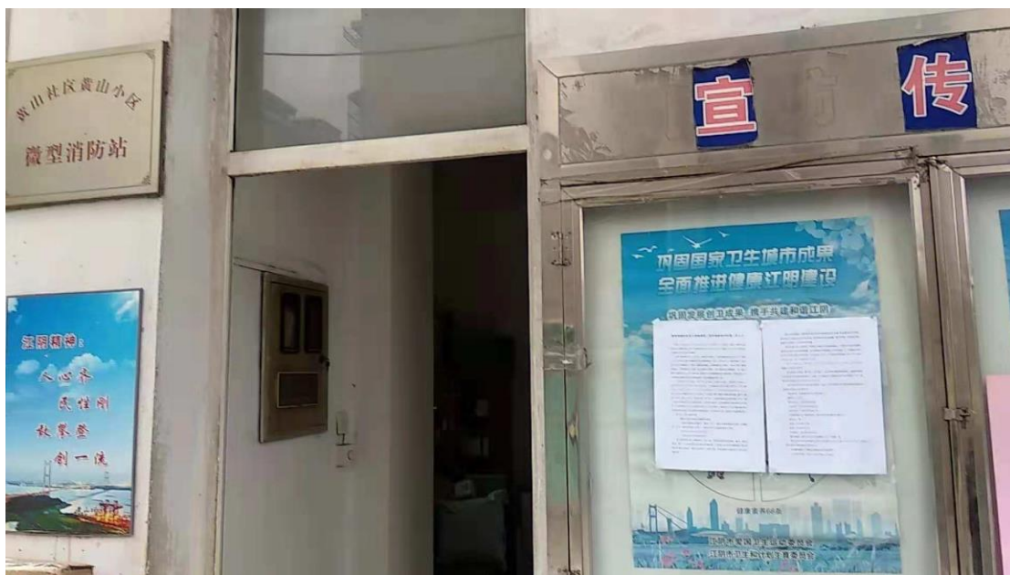
图 3.2-3 现场征求意见稿公示照片

张贴公示的地点均为沿线敏感点，基本为居民居住地，张贴位置为较明显，属于《办法》要求的公众易于知悉的场所符合《办法》要求。