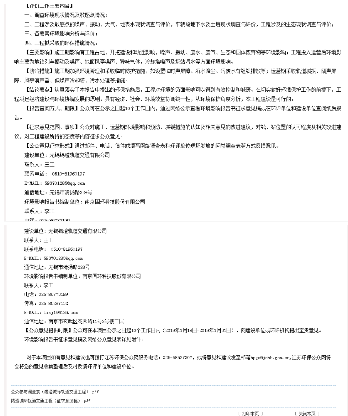
图 3.2-1 江苏环保公众网征求意见稿公示截图

江苏环保公众网是江苏省内知名的网络公示公共媒体网站,属于《办法》要求的建设项目所在地公共媒体网站,符合《办法》要求。