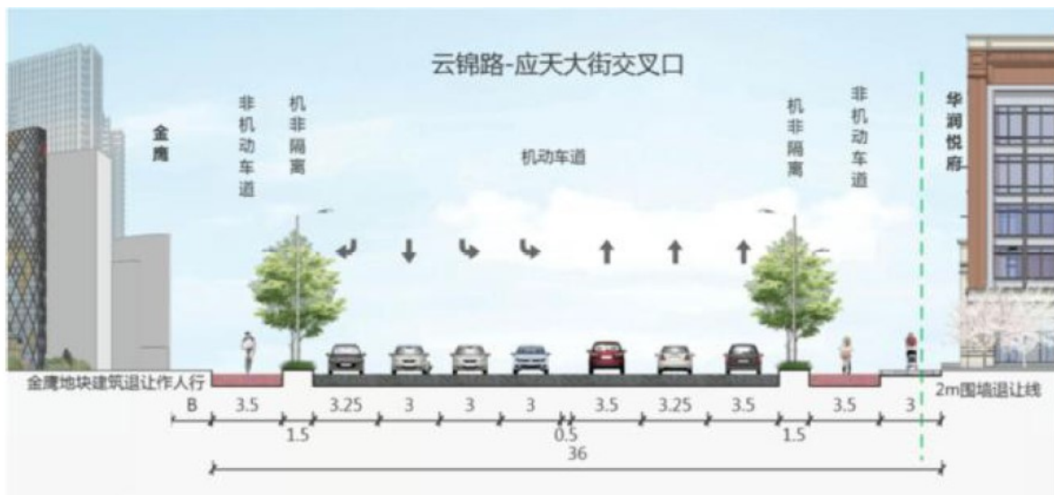
云锦路-应天大街交叉口横断面

(2) 云锦路-应天大街交叉口渠化段: Bm (人行道) + 3.5m (非机动车道) + 1.5m (侧分带) + 23m (机动车道) + 1.5m (侧分带) + 3.5m (非机动车道) + 3m (人行道)。